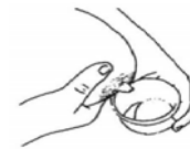
The Breastfeeding Network